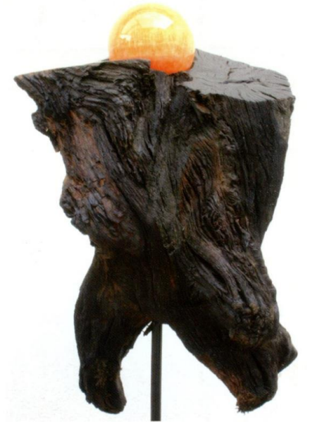
Embraced by history