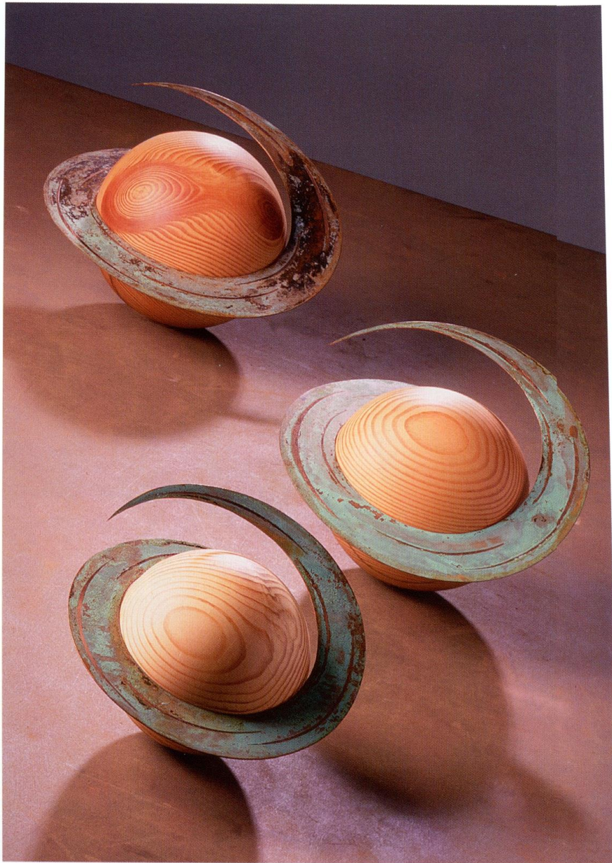
Evolution of a mind