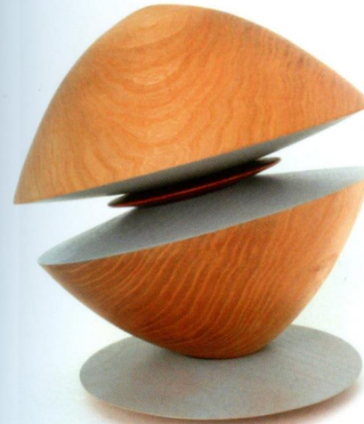
Each other poles