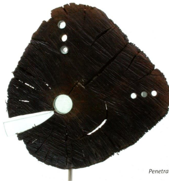
Penetration of history