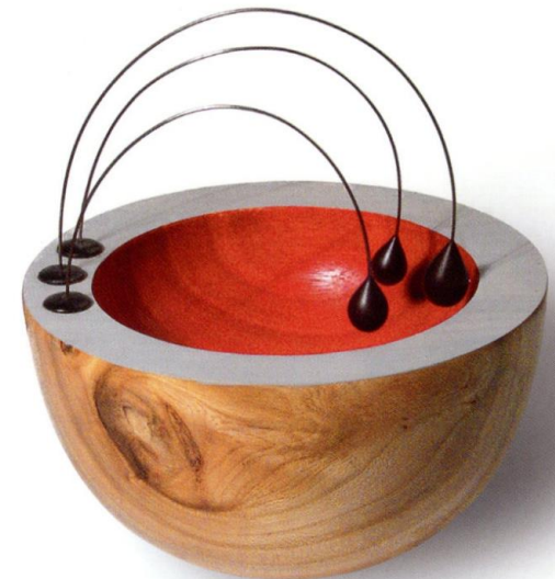
Blood and tears