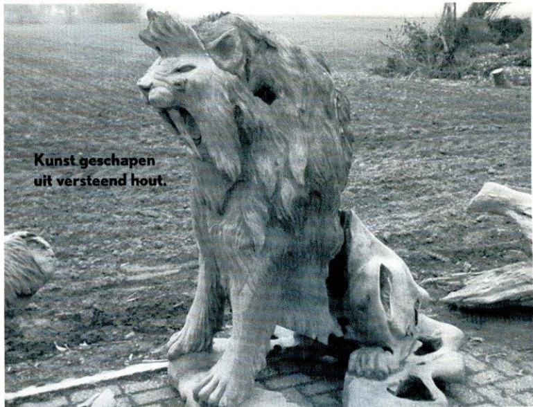
Kunst geschapen uit versteend hout.

Hout is voor Rouwkema een passie geworden. Hij noemt het een zeer boeiend materiaal met zijn structuren en prachtige vergroeiingen, met de regelmaat van de jaarringen en de woestheid in de vergroeiingen met daarin de worsteling om het bestaan. Sinds een jaar past de houtdraaier ook de techniek van buigen van hout toe in zijn objecten. Meestal gebruikt hij Europese hout-